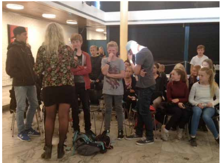
Nogle 8. klasses elever var modige nok til at sige deres mening højt i mikrofonen, mens andre var pinligt berørte.

Det var et succeskriterium, at det lykkedes at få ungdomsrådene til at deltage som medskabere af projektet, og at det lykkedes at bruge dem som en katalysator, der fik flere andre unge i deres netværk til at deltage. Et andet succeskriterium var, at samarbejdet med ungdomsrådene ville fortsætte efter projektet. Og at metoderne i projektet efterfølgende kunne bruges af andre biblioteker.