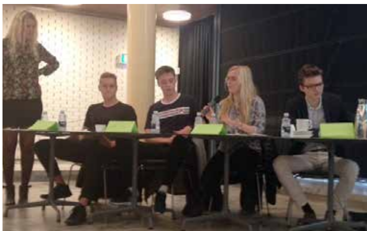
Ordstyrer og paneldeltagere, debatmøde Rødovre Bibliotek

Efterfølgende afholdt YouGlobe en workshop for de unge debattører, hvor de blev klædt på til at sidde i panelet, og som gjorde, at ordstyreren for debatmøderne på forhånd havde et godt kendskab til paneldeltagernes holdninger og personlige beretninger.