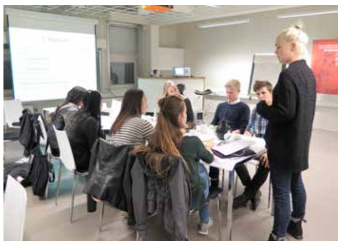
Målgruppen for skriveworkshoppen med Politikens debattør- og kritikerkole var unge i alderen 15 til 25 år.

Målgruppen var unge i alderen 15-25 år, og de deltog frivilligt. Vi lavede PR for workshoppen via Borupgaard Gymnasium, CPH West og TEC Ballerups Facebook-side. Derudover spurgte vi lærerne i de seks 8. klasser, der deltog i debatmøderne, om nogle af deres elever havde lyst til at deltage. København og Rødovre udbød også workshoppen i deres ungenetværk.