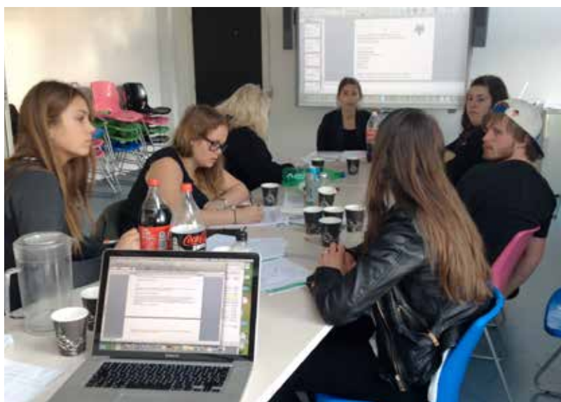
På workshoppen for unge frivillige på Ballerup Bibliotek nåede de unge frem til to emner, som skulle debatteres på de efterfølgende møder.

Konklusionen er, at det er svært at få unge til at tilmelde sig og holde fast i dem, for når datoen nærmer sig, har de fået andre planer eller glemmer at møde op. Før møde nummer to sms'ede vi alle de unge og mindede dem om vores aftale dagen efter. Det hjalp og er en erfaring, der er god at tage med videre.