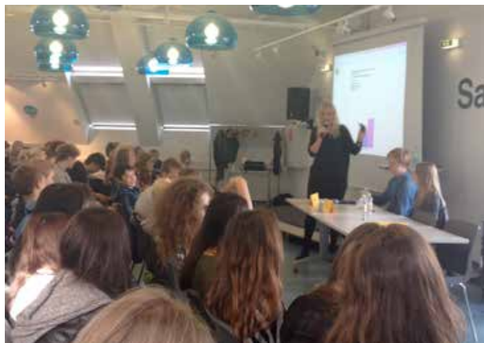
Cirka 175 elever deltog i mødet for 8. klasser i Ballerup Kommune på Ballerup Bibliotek.

mentarer via sms op til storskærmen. I afstemningerne deltog mellem 33 og 56 elever. Det var meningen, at Øbro Jagtvej skulle afholde to debatmøder, fordi de kun har et lokale med plads til ca. 50 deltagere, men det lykkedes ikke at få flere end to klasser til at tilmelde sig, hvorfor der kun blev afholdt et debatmøde der.